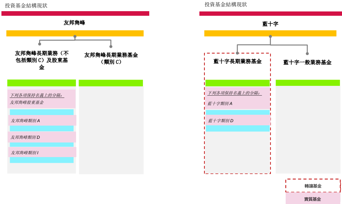
圖 3.2: 友邦雋峰在計劃實施後的基金結構